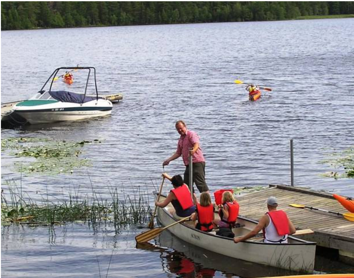
Turister på Runns Aktivitetscenter Främby Udde får hjälp med provturen