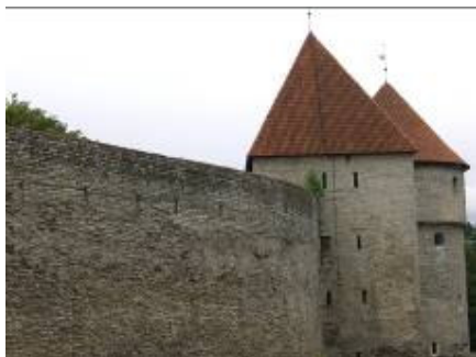
Tallinn. Stadsmur och försvarstorn.

Tallinn ”den danska staden” grundades 1232 av hansaköpmän från Visby och var länge en liten provinsstad. Tallinn och Riga ligger så nära varandra. Förutsättningarna har ofta varit de samma. Tallinn har, precis som Riga intagits av härar från olika länder. Men den stora skillnaden verkar vara att Tallinn aldrig har förstörts av inkräktarna. Vår guide förklarar att esterna hellre har givit bort sitt land eller kapitulerat. Därför finns i dag den medeltida, gamla staden kvar.