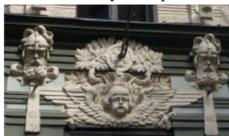
Riga. Utsmyckning från Jugendperioden

Staden är i dag en modern storstad. Bland intressanta byggnader finns bl a 800 vackra ungdomshus och marknadshallar, som under kriget var hangarer till zeppelinare.