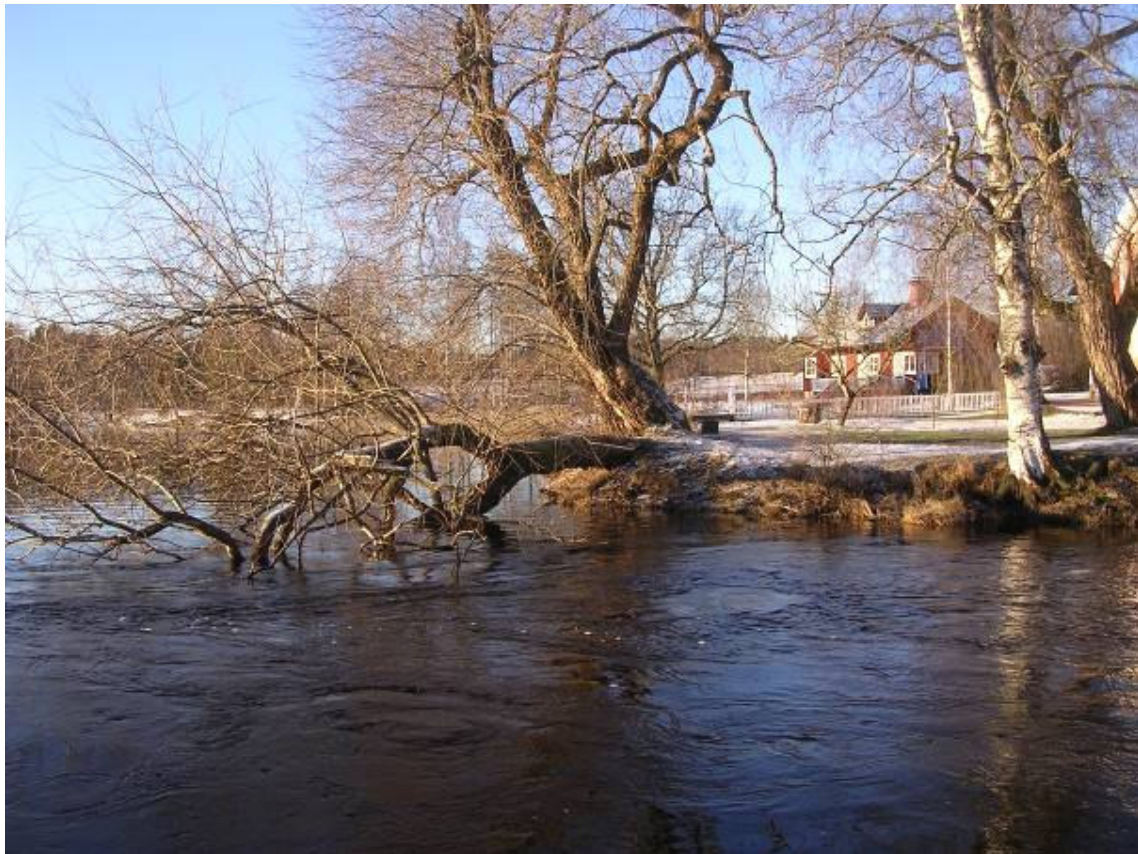
Vårvinter i Sundborn