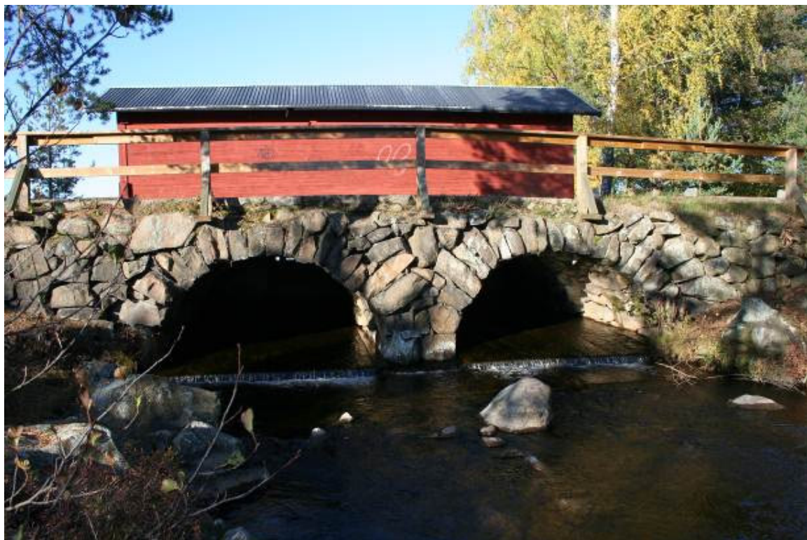
Stenvalvbron i Stennäset, troligen från 1700-talet, är en av Dalarnas värdefullaste. Den togs ur allmän trafik 1937.